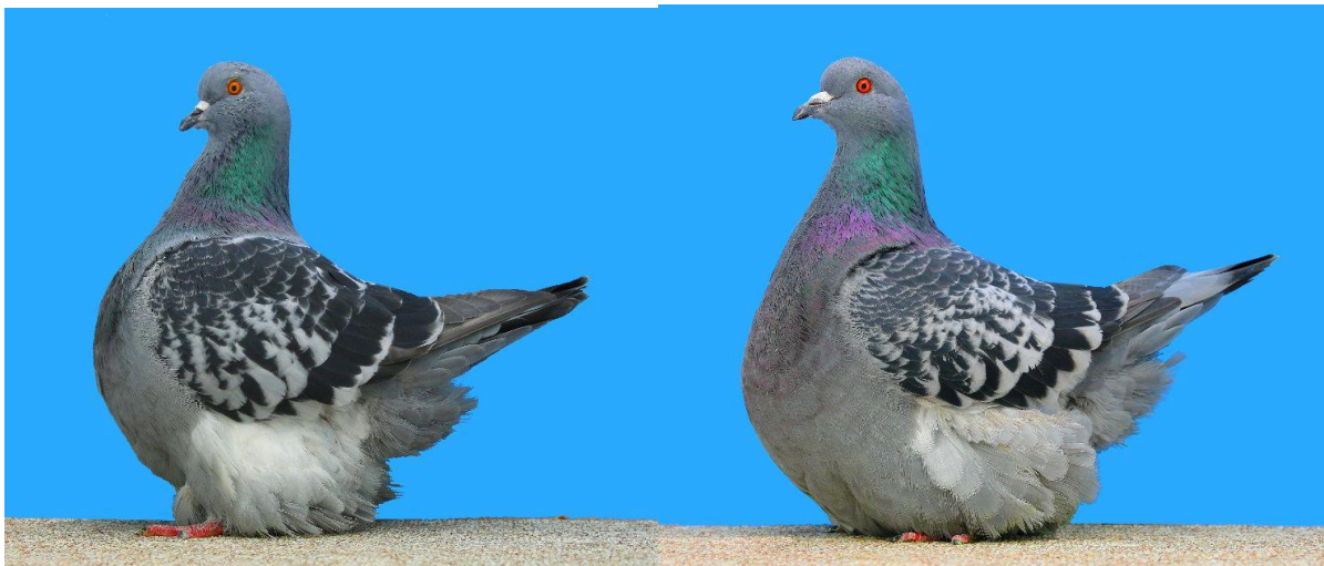
Champion de France Barthois